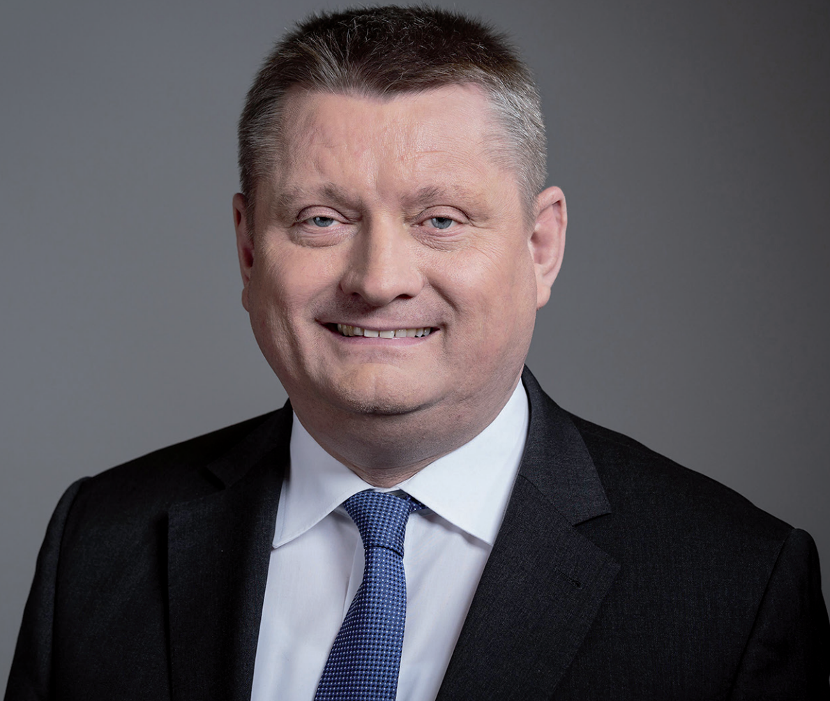
Hermann Gröhe, MdB Bundesminister für Gesundheit