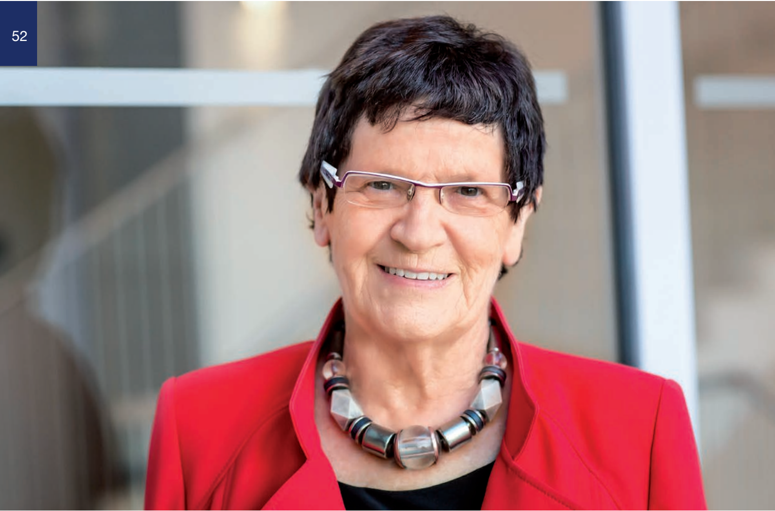
Prof. Dr. Rita Süßmuth Bundestagspräsidentin a. D.